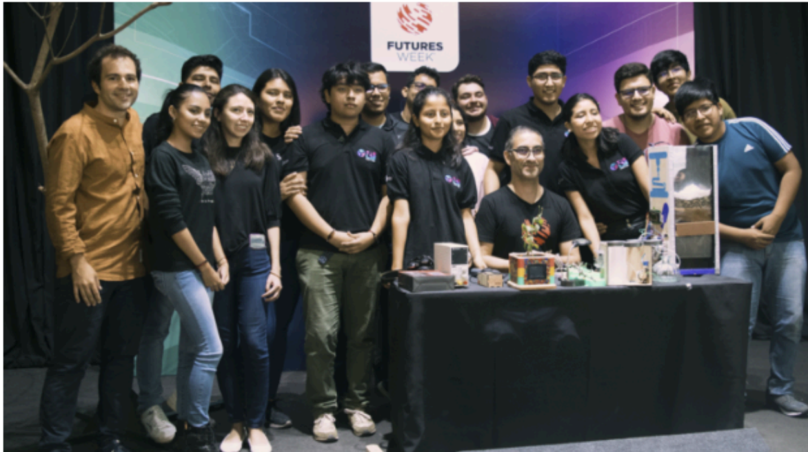
Jóvenes creadores de prototipos en el Futures Week